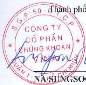
NA SUNGSOO Chủ tịch Hội đồng Quản trị

Thành phố Hồ Chí Minh, ngày 10 tháng 8 năm 2020